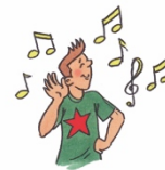
écouter de la musique

écouter de la musique rencontrer des amis / amies